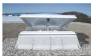
Insektenschutz für NRW für Erstmontage und zur Nachrüstung