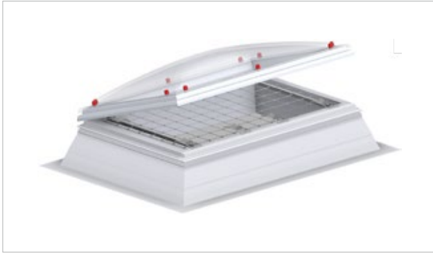
JET-LK-DDN, eingebaut auf GFK-Aufsetzkranz mit Lichtkuppel, lüftbar