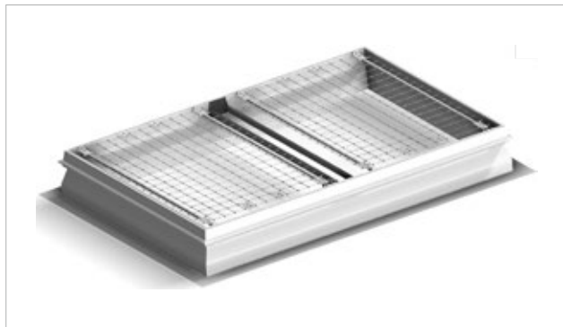
JET-LK-DDN für RWA-Lichtkuppel