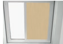
Transluzenter Rollvorhang aus Fiberglasgewebe Lichttransmissionsgrad ~ 4-12% Gewebe-Farbauswahl: Hellgrau, Mittelgrau Hinweis: andere Gewebefarben auf Anfrage