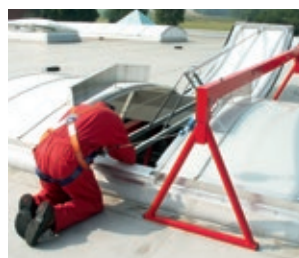
Aufbauvariante 1: lichte Breite 2985 mm mit Höhensicherungsgerät am Anschlagpunkt