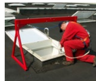
Aufbauvariante 2: lichte Breite 1685 mm