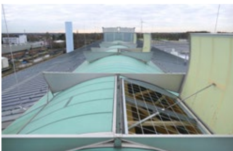
GRILLODUR®-DSG in einer Doppelklappe