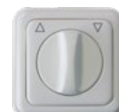
Lüftungsdreh- schalter (AP/UP)