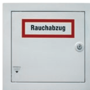
JET-RWA-Motor-Steuerzentrale inklusive Akkus als Notstromversorgung

Grundausrüstung JET-TR-24-V-RWA-Set für JET-Lichtkuppel