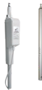
RWA-Spindelmotoröffner inklusive Konsole