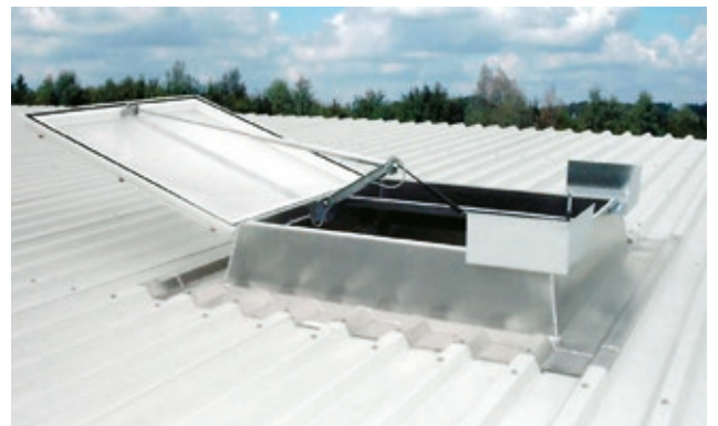
JET-Stahl-Alu-Verbund-TRP-RAK 30cm hoch mit JET-RWA-Lichtkuppel