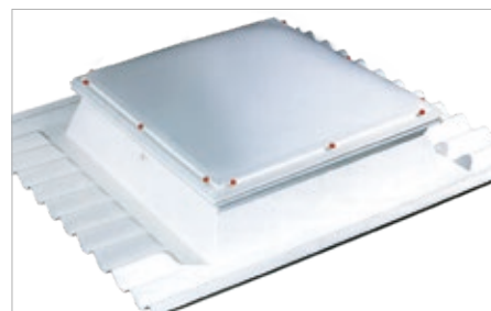
JET-GFK-WELL-AK 30cm hoch mit JET-TOP-90-Lichtkuppel