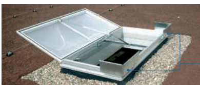
Świetlik kopułkowy JET do oddymiania z owiewkami do optymalizacji czynnej powierzchni oddymiania